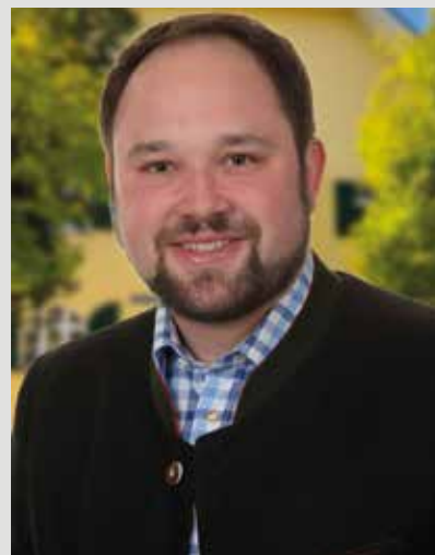
Hans-Peter Deifel Erster Bürgermeister Gemeinde Weihmichl