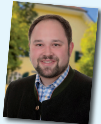
Hans-Peter Deifel Erster Bürgermeister Gemeinde Weihmichl